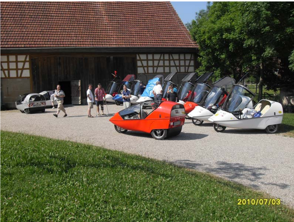
Drehstromanschlüsse ohne Ende...

Am nächsten Morgen machten wir uns auf zu einer Ausfahrt zum Freilichtmuseum Wackerhofen bei Schwäbisch-Hall, wo wir unsere Twikes mitten im Museumsgelände parken und aufladen durften.