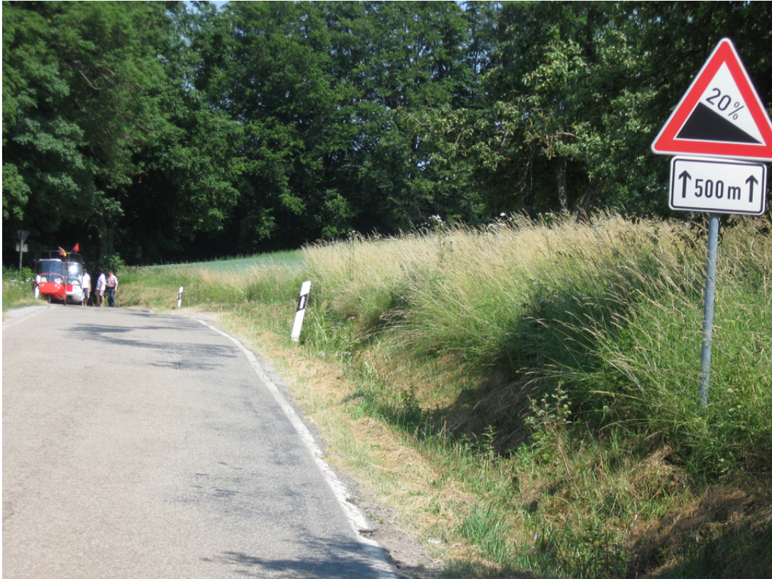
Anhalten an so einem Berg mag das Twike nicht so gern....