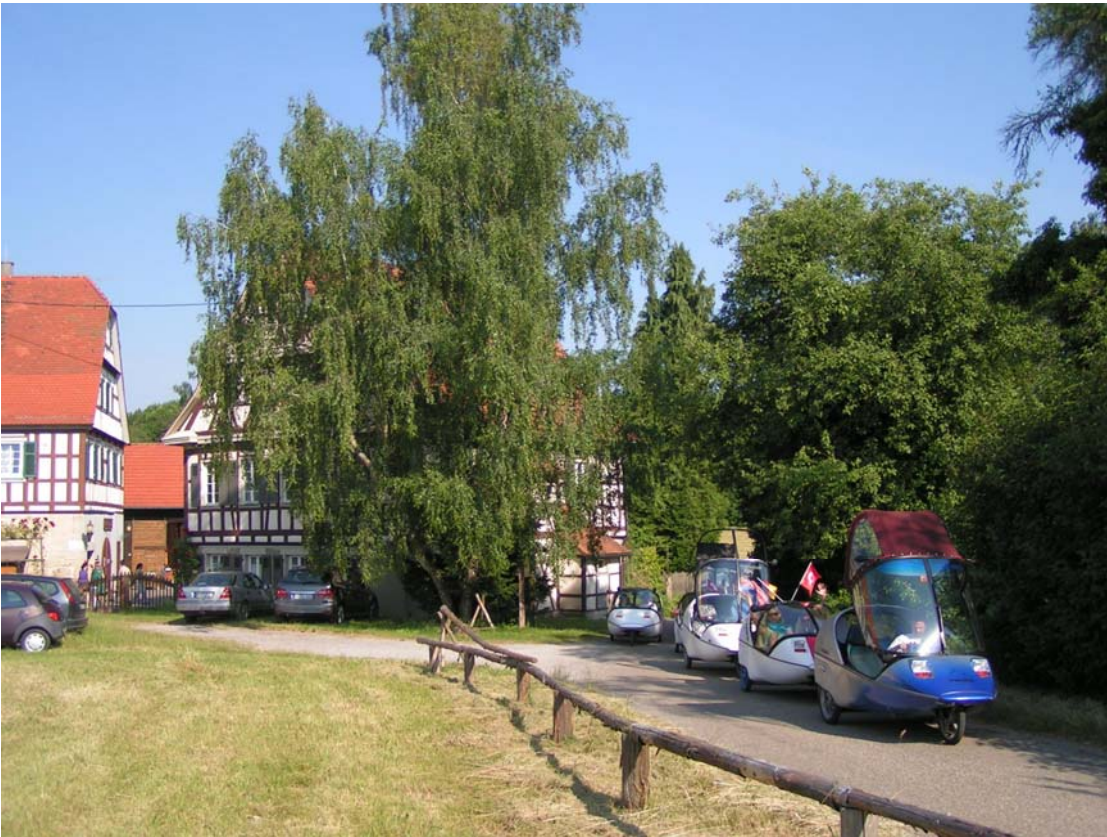
Die Twikes nehmen Aufstellung zur Ausfahrt

Am nächsten Morgen machten wir uns auf zu einer Ausfahrt zum Freilichtmuseum Wackerhofen bei Schwäbisch-Hall, wo wir unsere Twikes mitten im Museumsgelände parken und aufladen durften.