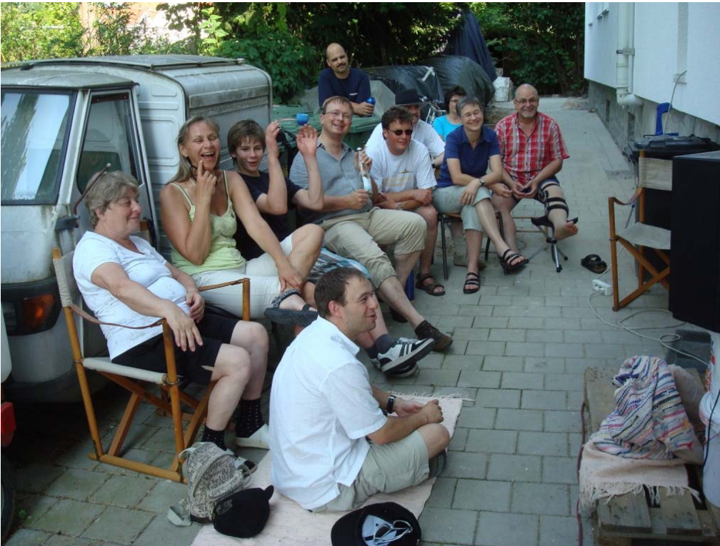
Im Schatten ließ sich das Fußball-Spiel genießen...